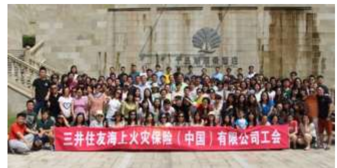
千島湖旅行団体写真